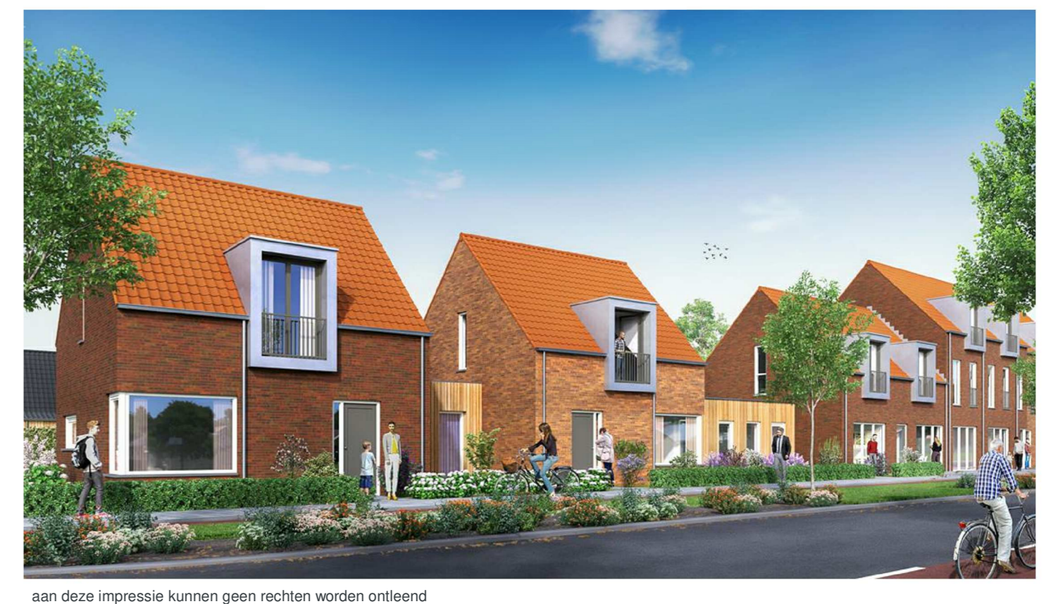
aan deze impressie kunnen geen rechten worden ontleend

a 20-09-2021; gewijzigd 02-12-2019; datum Nieuwbouw Singelgebied Domburg project Bouwbedrijf de Delta opdrachtgever Singel Domburg adresgegevens Singel Domburg bouwlocatie Verkooptekening Unit 6 onderdeel 1:100 / 1:50 / 1:25 schaal 0917G-VK-140 project- en tekeningnummer WE projectfase SP: projectmanager JS: getekend RoozRooz Architecten 's Gravenpoldersweg 1c 4462 CC | Goes 0113 237650 goes@roosros.nl www.roosros.nl