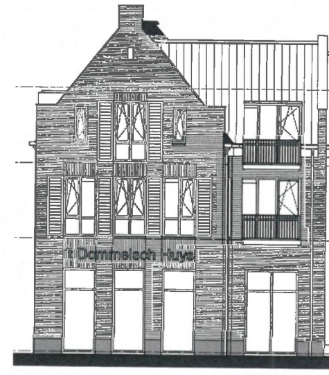
Oostgevel (1:100) Nieuwe winkelstraat - pleinzijde