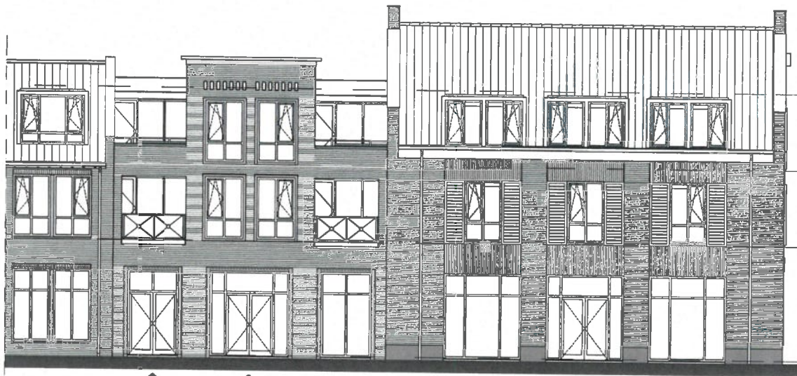
Noordgevel (1:100) Torenstraat