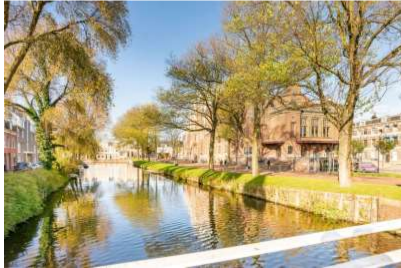
Cruquiusstraat 9a Haarlem Begane grond