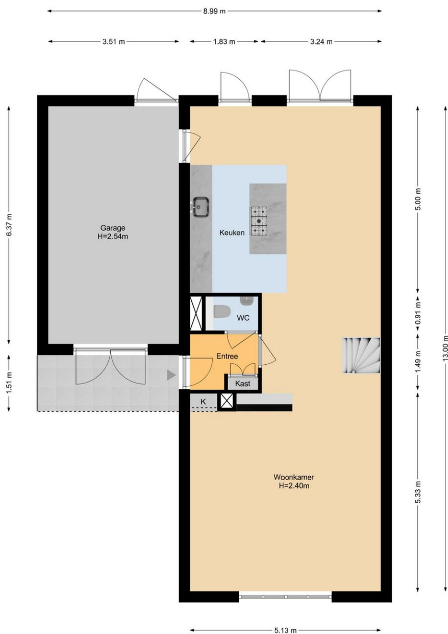
De Zijpe 24 | Naaldwijk Begane Grond

De plattegronden zijn geproduceerd voor promotionele doeleinden en ter indicatie. Aan de plattegronden kunnen geen rechten worden ontleend. www.woonkeur365.nl