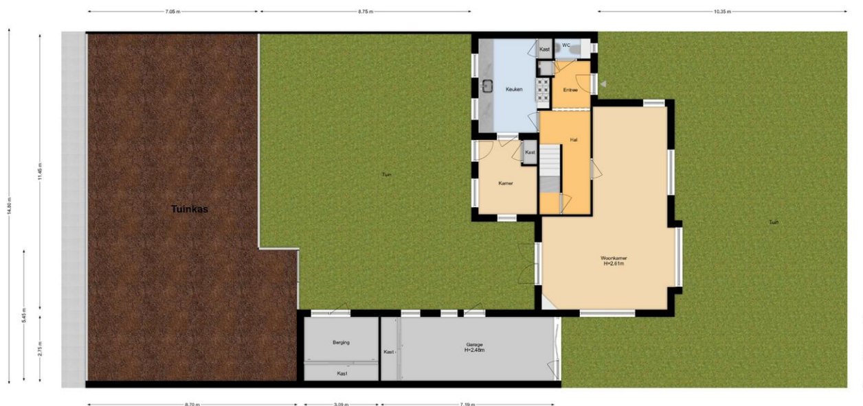
's-Gravensandseweg 46D | Naaldwijk Situatie

De plattegronden zijn geproduceerd voor promotionele doeleinden en ter indicatie. Aan de plattegronden kunnen geen rechten worden ontleend. www.woonkeur365.nl