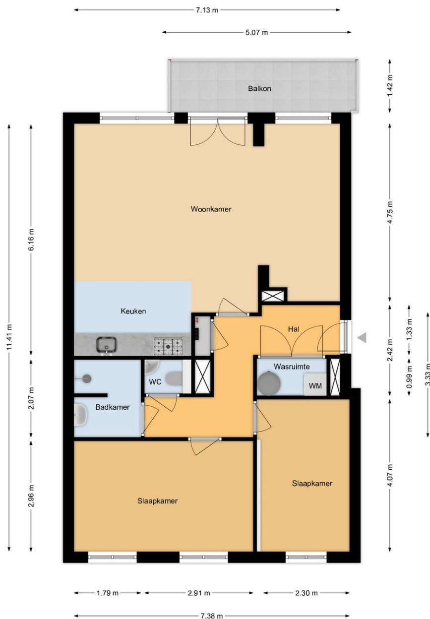
Laterastraat 61 | Naaldwijk 2e Etage

De plattegronden zijn geproduceerd voor promotionele doeleinden en ter indicatie. Aan de plattegronden kunnen geen rechten worden ontleend. www.woonkeur365.nl