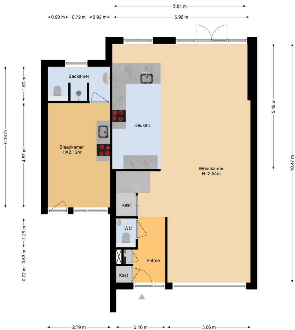
Rozemarijn 155 | Wateringen Begane Grond

De plattegronden zijn geproduceerd voor promotionele doeleinden en ter indicatie. Aan de plattegronden kunnen geen rechten worden ontleend. www.woonkeur365.nl