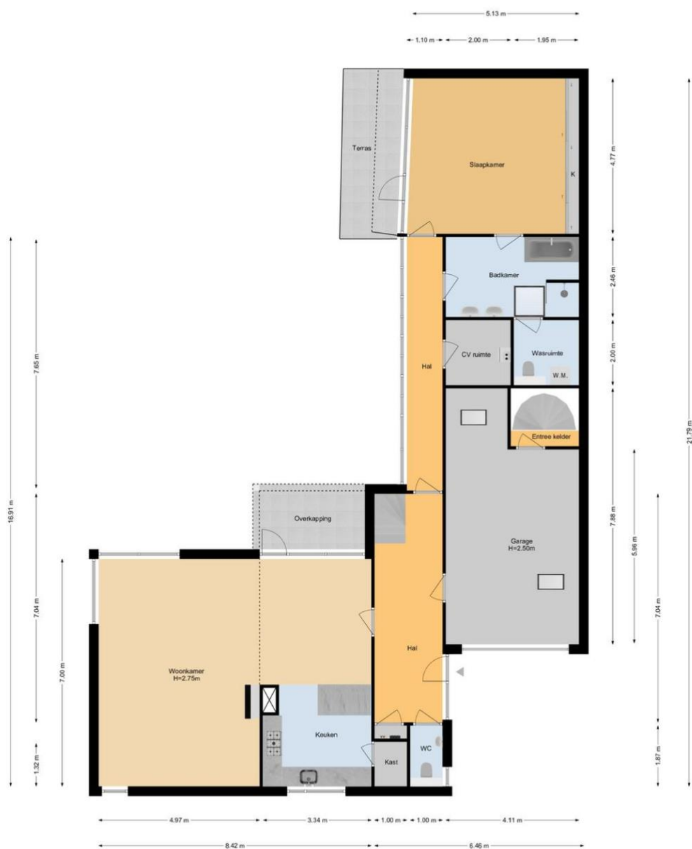
Rozenstraat 20 | Naaldwijk Begane Grond

De plattegronden zijn geproduceerd voor promotionele doeleinden en ter indicatie. Aan de plattegronden kunnen geen rechten worden ontleend. www.woonkeur365.nl