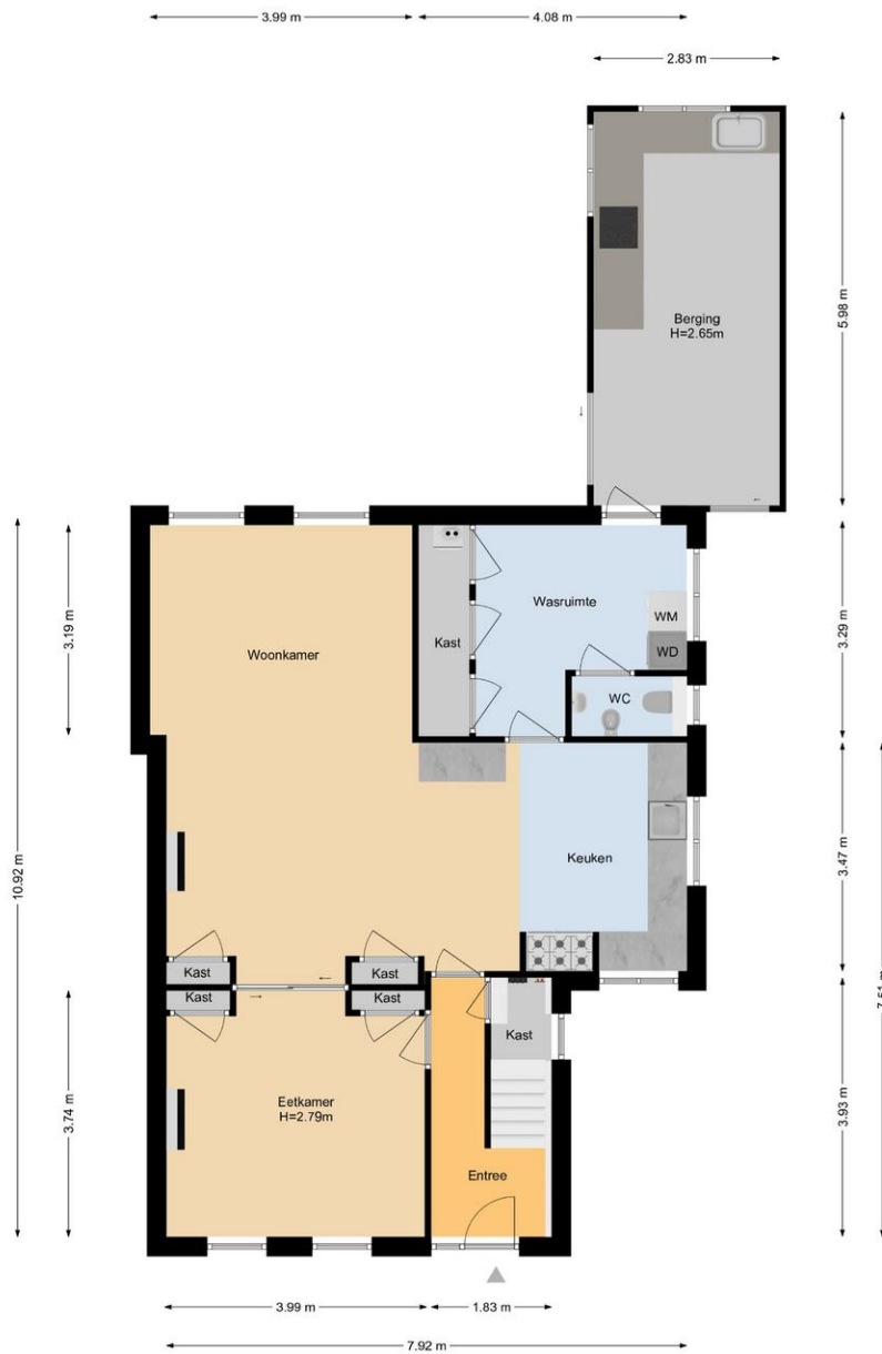
Maasdijk 10 | 's-Gravensande Begane Grond

De plattegronden zijn geproduceerd voor promotionele doeleinden en ter indicatie. Aan de plattegronden kunnen geen rechten worden ontleend. www.woonkeur365.nl