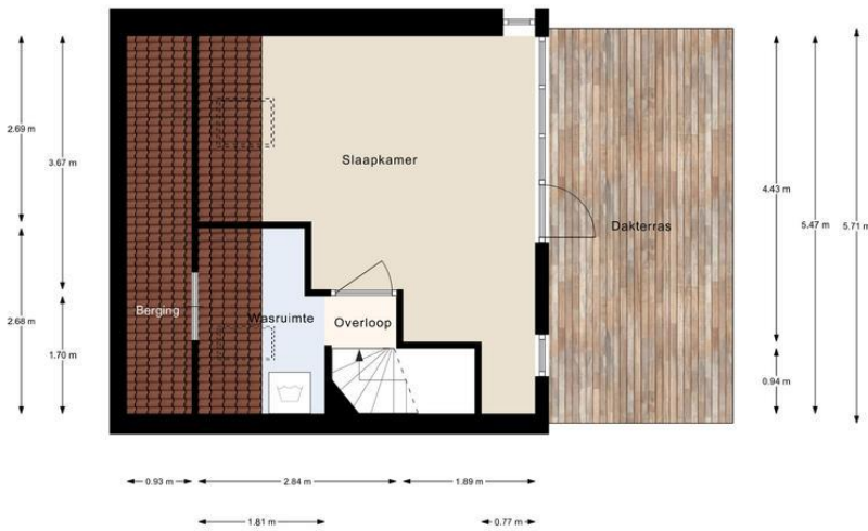
Ebenezer Howardpark 2, Almere | 2e Verdieping H = 2.39 m