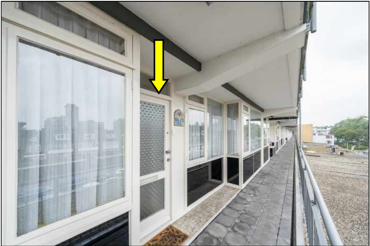
entree galerijzijde 2e verdieping