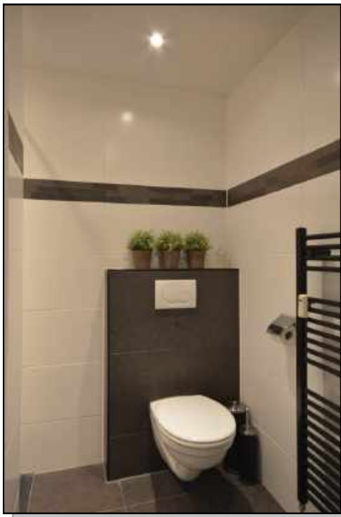
2e toilet in badkamer