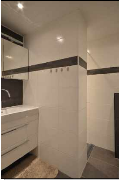
badkamermeubel en douche