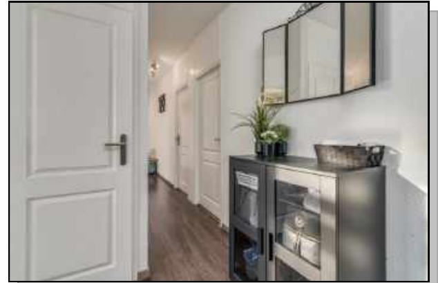
entree/hal 1e verdieping