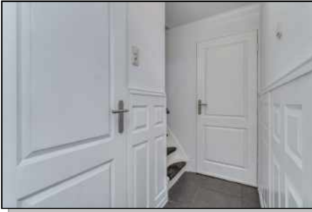
overloop begane grond