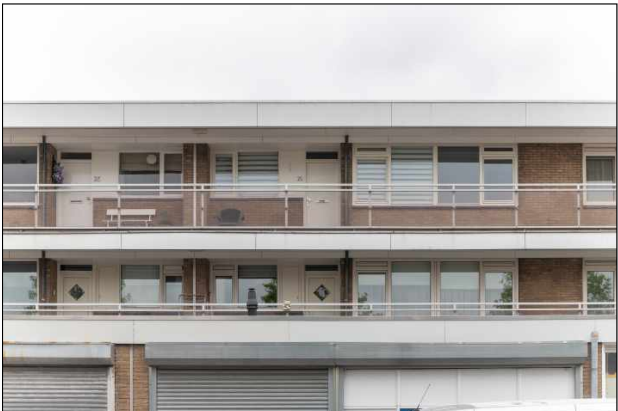
aanzicht complex galerzijde