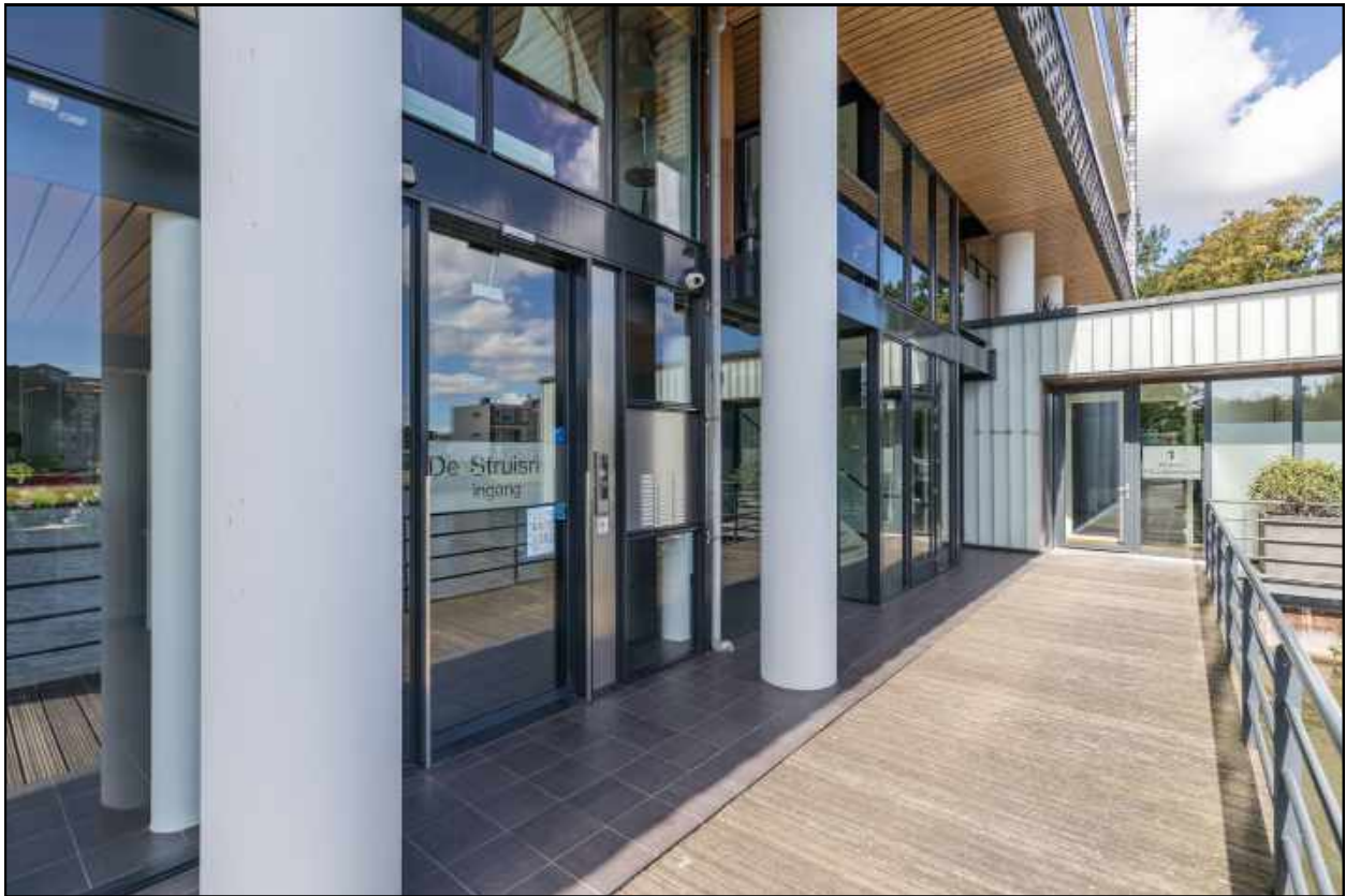
entree centrale hal begane grond